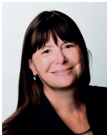
Ulrike Höfken Ministerin für Umwelt, Landwirtschaft, Ernährung, Weinbau und Forsten Rheinland-Pfalz